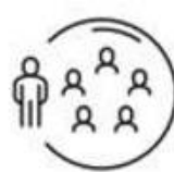
Beperk je nauwe contacten