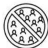
Volg de regels over bijeenkomsten

Diezelfde blik geldt voor de 10 geboden. Het blijft een nuttige algemene insteek om waar van toepassing met deze 10 geboden rekening te houden ook al zijn regels in sommige gevallen soepeler of zonder beperkingen bij culturele activiteiten.